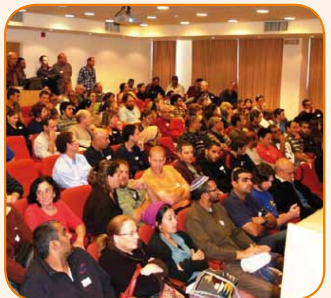
היונקיסטים צמאים למפגש ולמידע עדכני