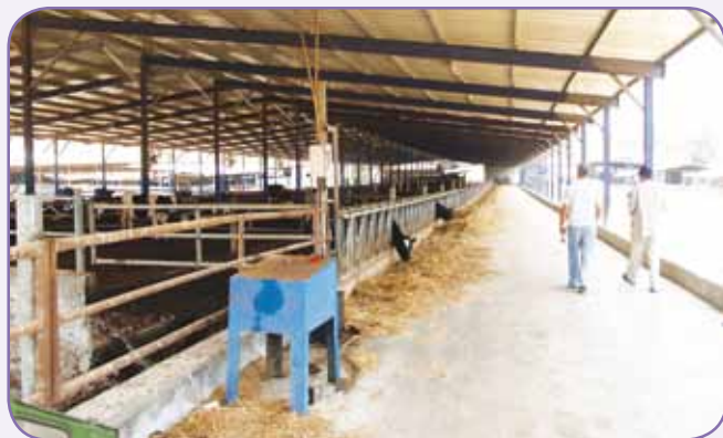
רפת אבישי מחפוד