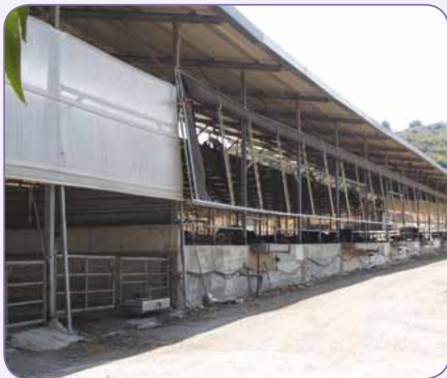
וילונות צד - מסמון