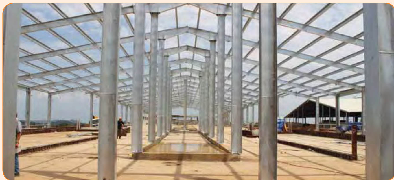
מכון החליבה החדש והגדול נבנה בווייטנאם

"המתחרים שלנו הם בעיקר החברות הגדולות - דלוואל ווסטפליה. הן עולות עלינו בסדרי גודל וכושר התחרות שלנו לא יכול להימדד