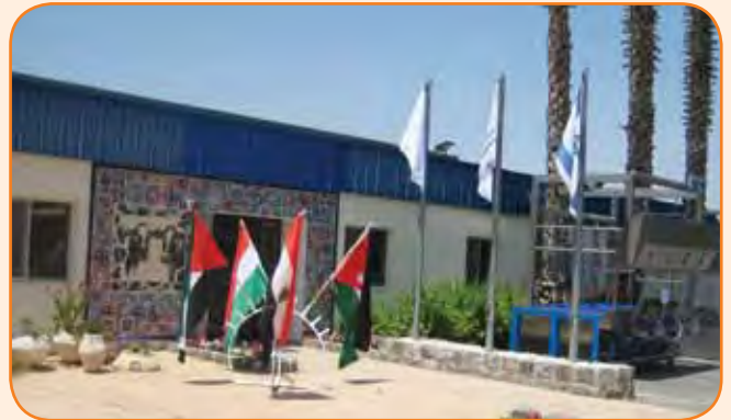
אירוח פלסטינאים לקורס רפת במפעל באפיקים

מניסיוננו, הפעילות הרצויה היא עם מפיצים מקומיים שמגויסים לחברה, רוכשים את הדנ"א של צ.ח.מ. אפיקים ומחויבים אליה ועד היום הצלחנו בכך