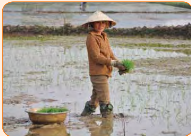
בידול האורז מרכזי מאוד אצל הוייטנמים

"שואלים אותנו בחו"ל למה הרפתנות בישראל טובה מאוד. התשובה שלנו היא, שלנו אין מסורת ואנחנו לא מדינה של 200 שנה עם דורות של רפתנים. לפני 100 שנה באו אנשים משכילים לישראל והקימו חקלאות יש מאין. הם ראו בחקלאות אמצעי ליישוב הארץ וחשבו שונה מהחקלאי המסורתי והם העזו, למדו, שאלו שאלות, והתעוזה הביאה לחשיבה שונה מהעולם שהפכה, ברבות הימים, לענף יצוא של