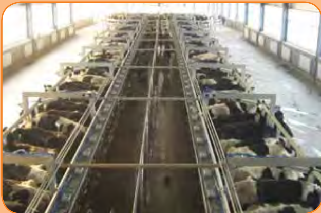
פרות בחליבה פרלל - בסך הכול יהיו 2,500 ראש

החוה החדשה נקראת Qutou Farm ומוקמת בדרום מזרח בייג'ין. שיווק החלב יתבצע על ידי חברת החלב הסינית Sanyuan ובשונה משאר הרפתות המקובלות בעולם, היא תתמקד רק בייצור חלב ולא יהיו בה עגלות. ■