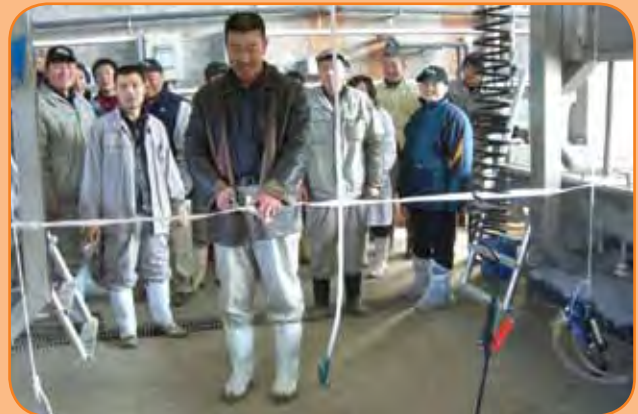
חונכים מכון חליבה ענק 48x2 - חולב כ-100 פרות בו זמנית

בגד"ש, מכונאים מרכזי מזון והכול בתנועה ובהתייעצות עם גורמים רבים. כשאתה בתהליך התמודדות, הכול תיאורטי, אך ברגע שאתה זוכה זה הופך למוחשי ומהיר מאוד כי לוח הזמנים מחייב. המורכבות של הפרויקט גדולה מאוד - יש לגשר על פער תרבותי, תנאי סביבה, התאמה של הידע הישראלי למקום אחר וקשה-טרופי.