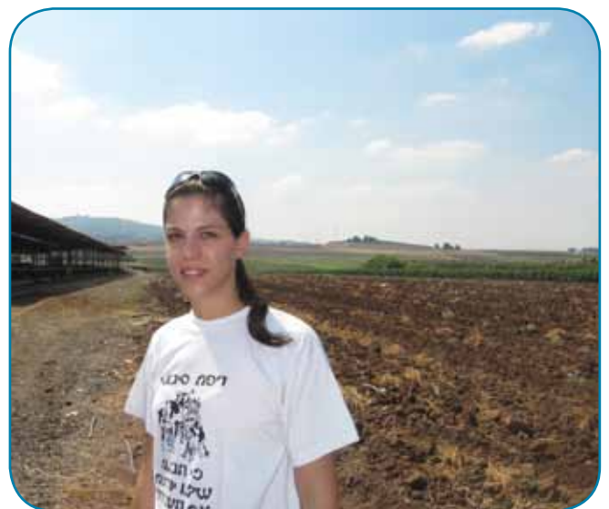
ענבל על רקע גבעת בית העלמין של תל עדשים