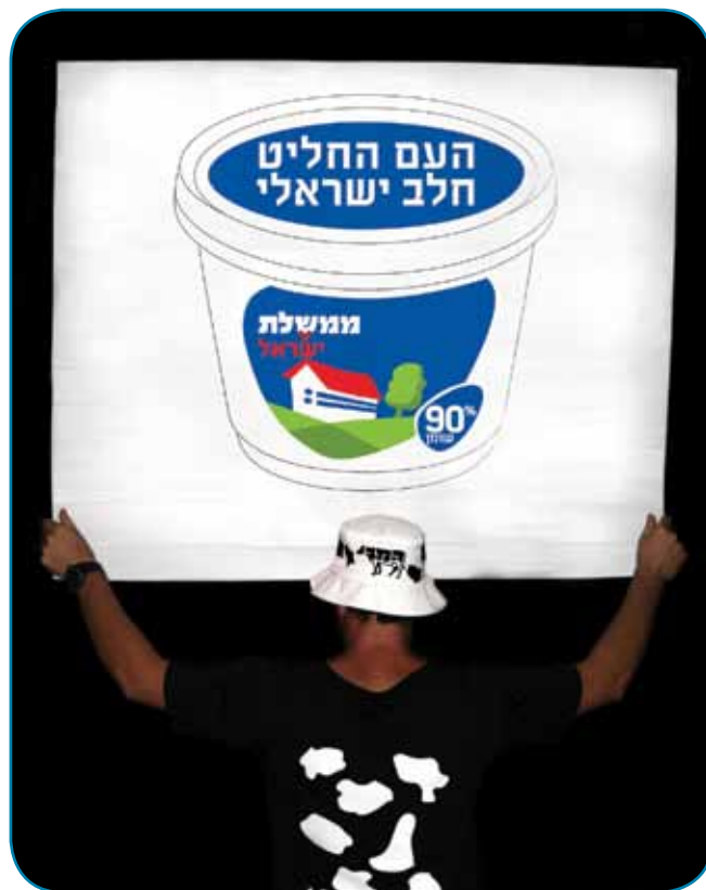
אחד משלטי התמיכה בעצרות במחאה ברחבי ישראל