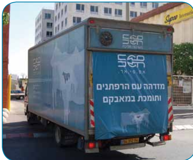
חברת א.ס.י.אר מזדהה עם רפתני ישראל