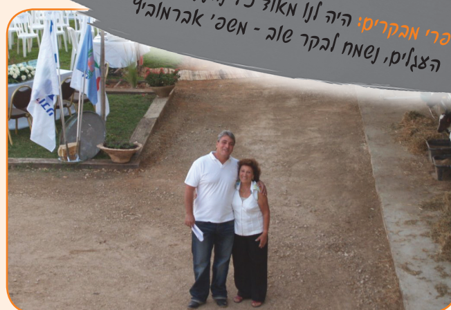
ארז ואימו במתיחה

סכרי אבקריס: היה לנו מאוד כיף נהנינו מהגמעת הצגים, נשמח לבקר שלב - משכ' אברמוביץ