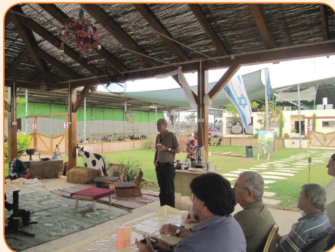
סכנת קליטת המבקרים