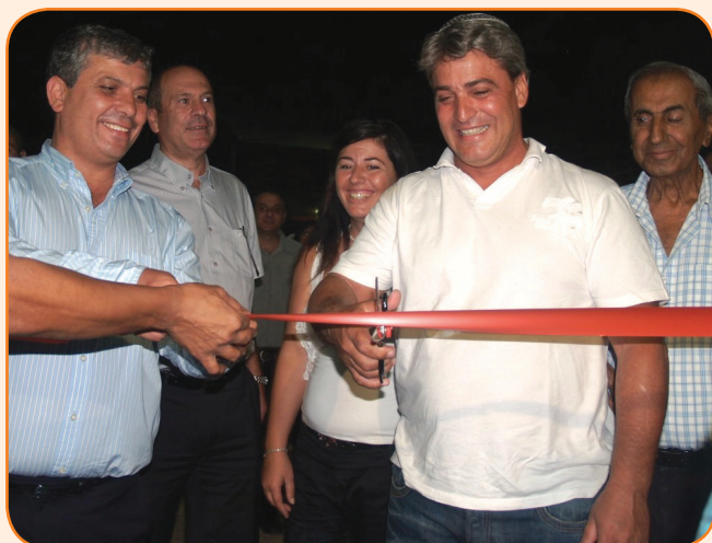
שר החקלאות שלום שמחון חונך את מיזם התיירות

בקורס קיבלה הלן את הכלים כיצד לבנות עסק חדש ותיירות במיוחד. הם נעזרו במת"י - חממת תיירות בנתניה שאנשיה מלווים את ההקמה, התכנון והבנייה - "נעזרנו בכל כלי שהמשרד העמיד לרשותנו וזה היה