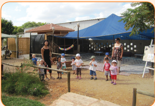
ימי הולדת וקבוצות הם מרכיב חיוני בימי חול