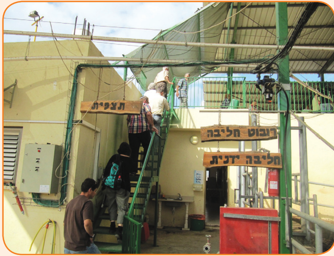
עולים לתצפית על תוך הרפת בסככה

התקופה הטובה ביותר היא זו שבין חגיגות שמחת החלב בפברואר, שבהן מועצת החלב עושה את הפרסומים, לבין חג השבועות שכולם מגיעים. קיץ זה ים וברכה ואילו בחורף אנשים יוצאים בשבתות יפות. הקבוצות בגודל 20-30 איש ובשבת רגילה יש כ-4 קבוצות.