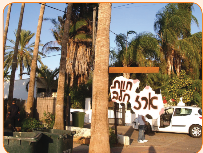
ארז חוות חלב במושב ניצני עוז