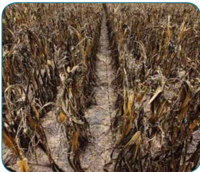
בצורת שפוגעת קשות גם ביבולי התירס

על פי נתוני הבנק העולמי, מחיר החיטה זינק בכ-50% מאז אמצע יוני, מחיר התירס עלה בשיעור חד של כ-45% ומחיר הסויה עלה גם כן, בכ-30%.