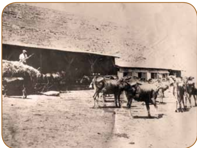
רפת עין חרוד ליד המעיין - שנות ה-20

צורת הארגון שלנו אינה נותנת לנו, עד היום, את האפשרות לדאוג באופן משותף לעתידנו. כל מקום דואג לצרכיו הוא. ואסוננו הוא שכולנו חושבים שע"י רפת גזעית נגיע יותר מהר לתוצאות טובות. היחס האדיש שאנו מראים לרפת הערבית מתבאר ע"י הקושיים הגדולים שאנו נתקלים בהם בבואנו לגדל פרה ערבית. אחד הקושיים הוא חסרון רועים. לו הייתה לנו ברורה שאלת הגזע, הייתה ממילא מסתדרת שאלת הרועים: היינו מסדרים