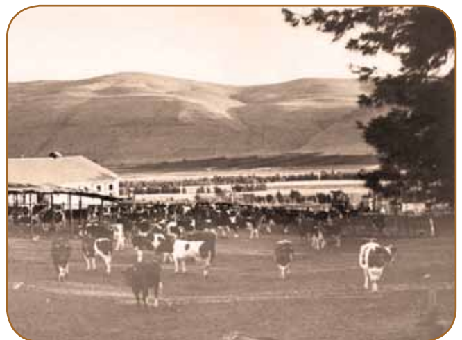
פרות ערביות בעין חרוד שלרגלי הגלבוע