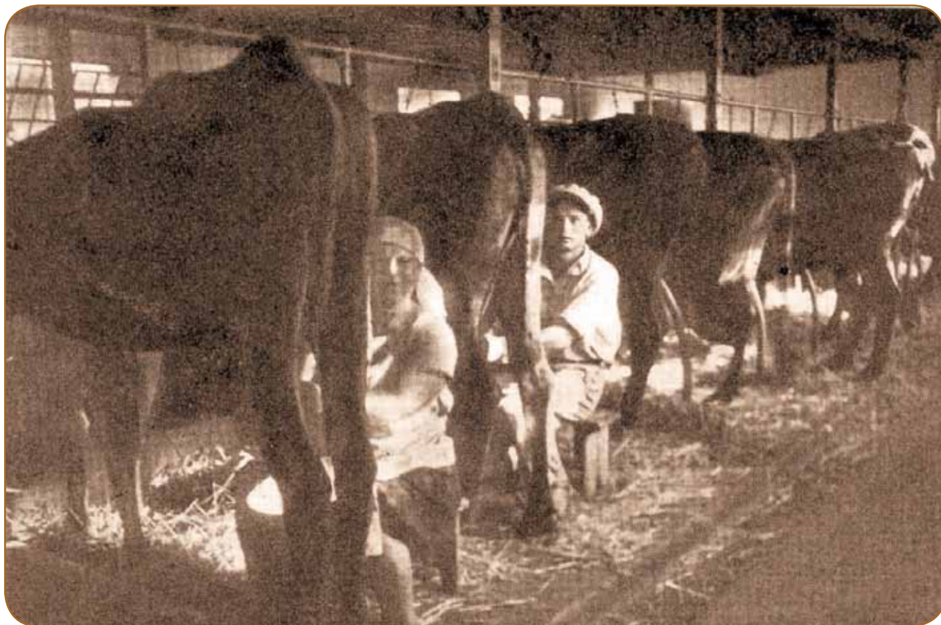
חליבת פרות ערביות ברפת "המעין"

אוכל מרוכז, ירק וטיפול טוב. אילו הוצאנו את כל זה על הפרה הערבית, אילו האכלנו אותה באוכל מרוכז, ואפילו בכמות קטנה של 1 1/2 ק"ג ליום, היינו מגיעים לתוצאות חשובות מאוד. לדוגמא נזכיר כאן את הפרה ... שהשנה אנו נותנים חוץ ממרעה גם אוכל מרוכז (1 - 1 1/2 ק"ג ל...). אנו רואים שבמשך 6 החודשים לחליבתה הגיעה כבר ל-1400 ליטר: אותו הסכום בערך נתנה בשנה שעברה במשך 9 חודשים.