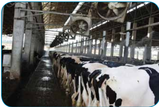
ציון פרות בכל מקום

נאוה , פנסיונרית בחצי משרה מרגבה - כלכלת הרפת ועבודה משרדית -