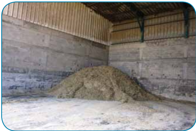
בתום יום העבודה מכינים פרמיקס יבש להזנה למחרת

אלף סת"ס. בקיץ חורגים הרבה כי יש הרבה המלטות, וכך מייצרים הרבה גם בחורף וגם בקיץ. מפרידים חלב סומטי לפי הצורך ביונקיה - כיום 350 ליטר מ-18 פרות ולחלקן לכד רבע.