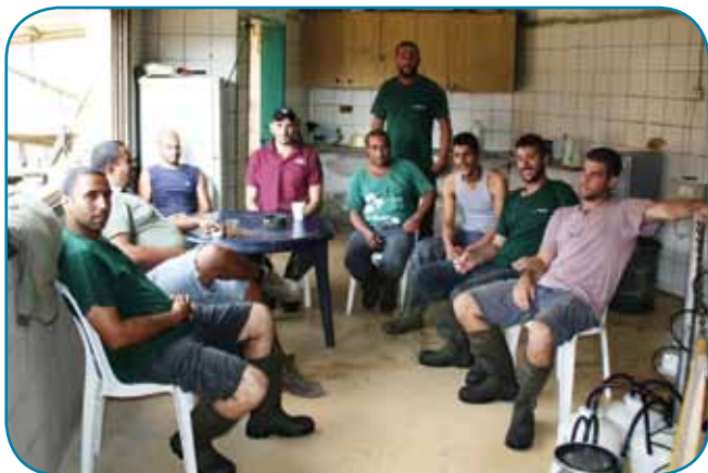
צוות עובדים מסור ומיומן