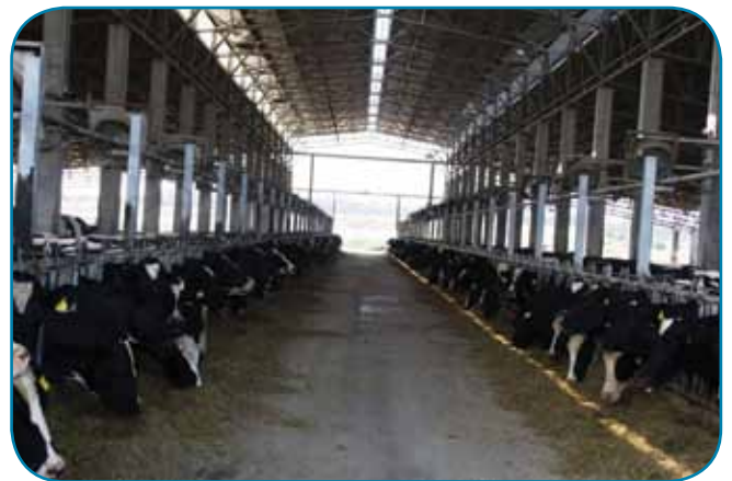
רפת גליל מערבי - מטופחת ויפה