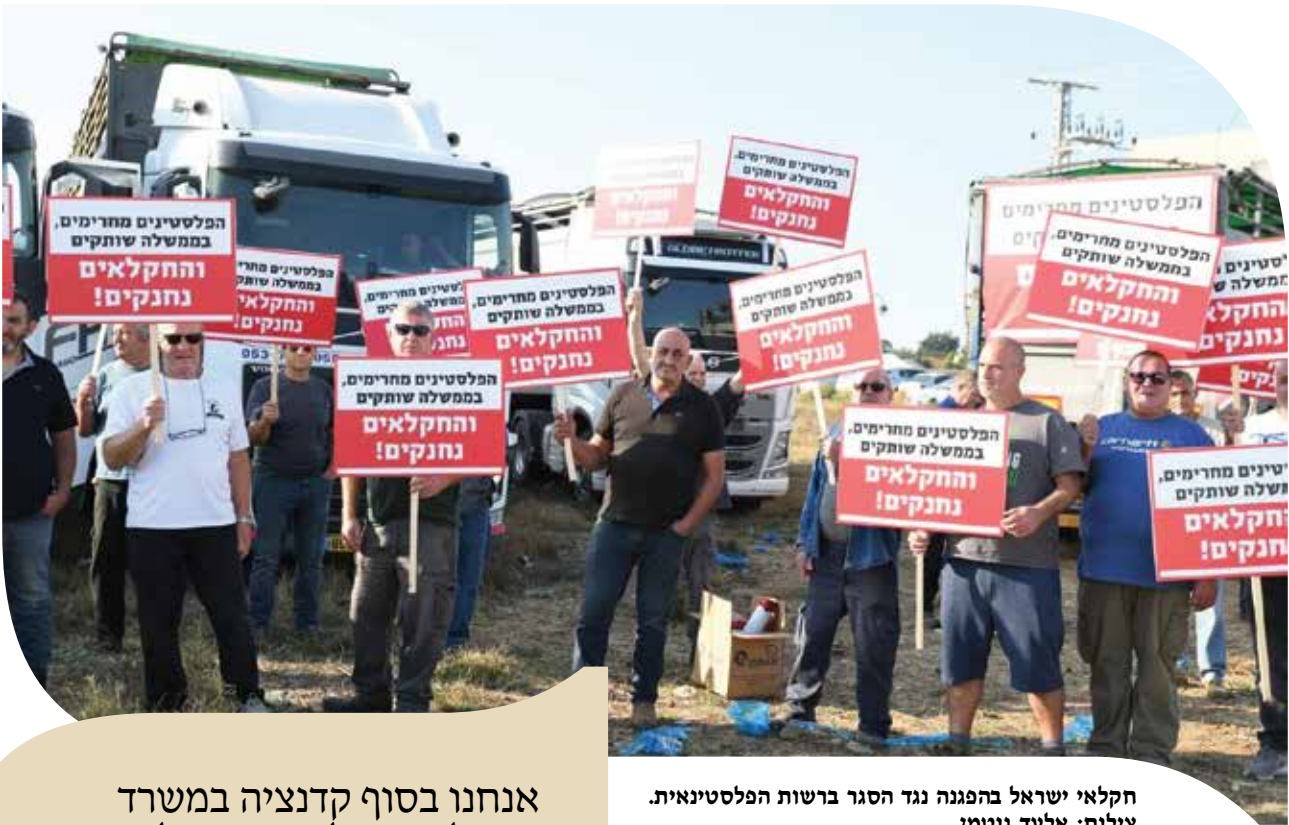
חקלאי ישראל בהפגנה נגד הסגר ברשות הפלסטינאית.

אנחנו בסוף קדנציה במשרד החקלאות של אנשים שלא ידעו לטפל נכון בענף כל כך חשוב כמו ענף החלב. בתקופתם מועצת החלב מתייבשת ומאבדת את היכולת לנהל את הענף